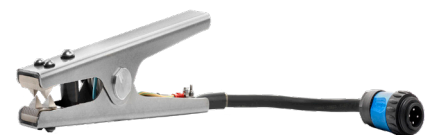
SG/B-CMS1-SCM, tang met M connector