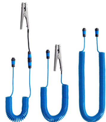
SG/B-SP1-HD, tang en connector