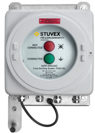
SG/E-TES01-V2/EX met opberghaak en wartels.

De TES01-V2/IP variant mag gebruikt worden in ATEX/IECEx zones 21 en 22. De TES01-V2 EX is geschikt voor gebruik in ATEX/IECEx zones 1,2, 21 en 22.