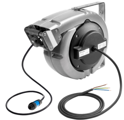
SG/E-CR1/65-15SCF, met F connector

Bij actieve tangen zijn de twee klemkaken geïsoleerd van elkaar als ook geïsoleerd van het klemlichaam zelf. Zolang de tang niet met een geleidend voorwerp verbonden is, blijft de kring tussen de klemkaken open en kan er geen stroom vloeien. Zodra de klem aan het aardingspunt van de vrachtwagen is bevestigd, wordt de kring gesloten. Optioneel kan een opbergpunt voor de tang met of zonder afdakje geleverd worden.